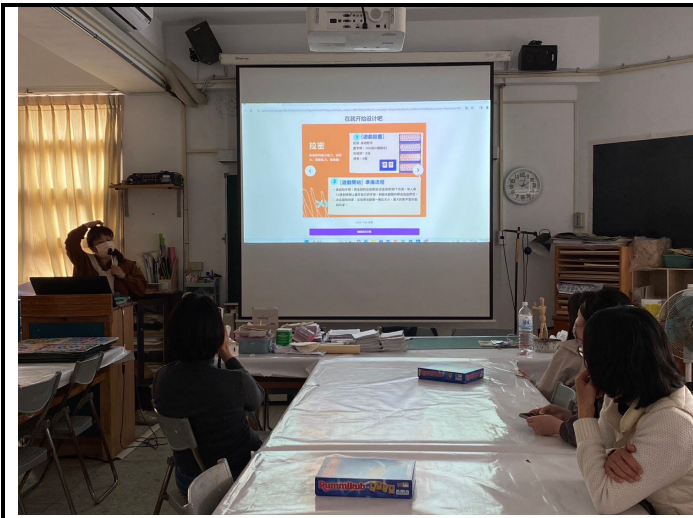
說明：輔導媒材融入各領域中