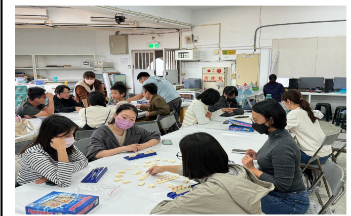
說明：夥伴們分組操作