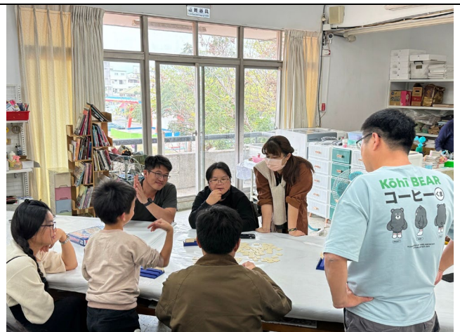
說明：大家一起動動腦