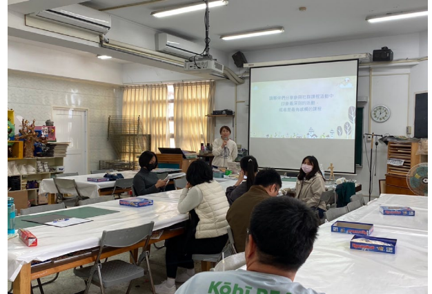
說明：分享此次社群的心得感想