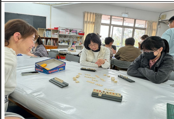
說明：夥伴們分組操作